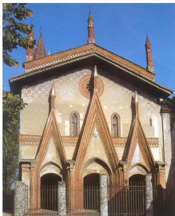
S. Antonio di Ranverso